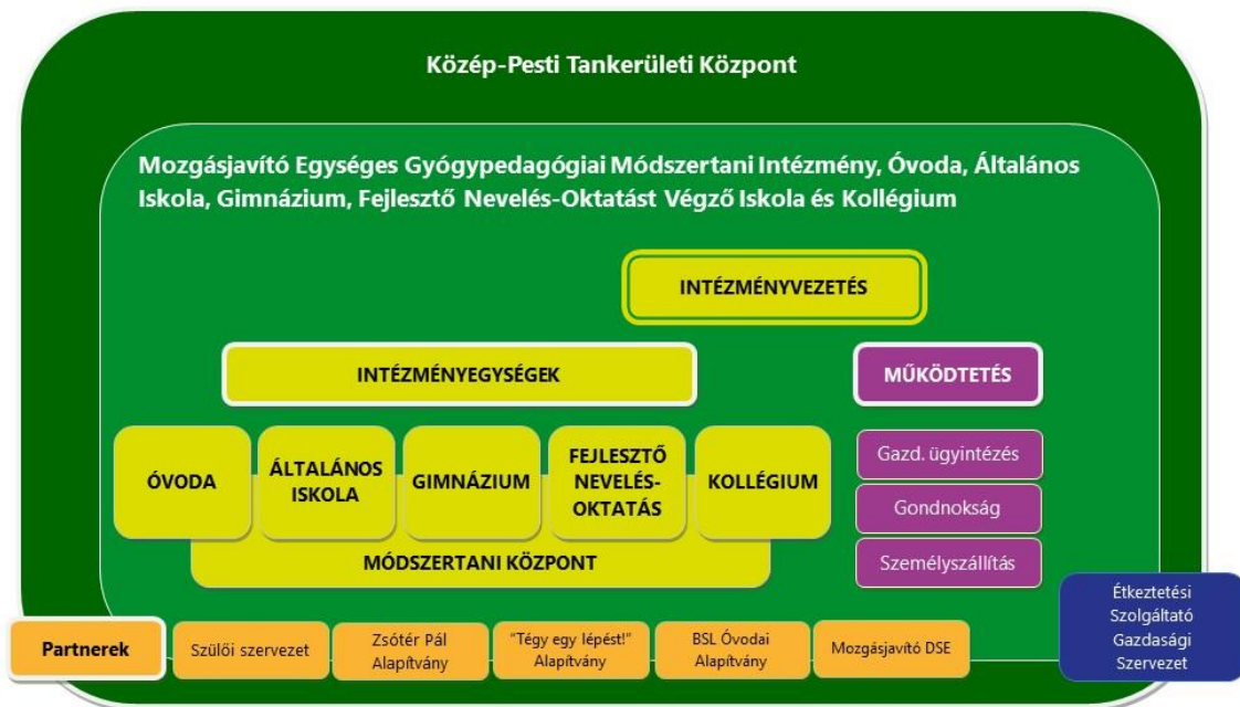
1. ábra Az intézmény szervezeti ábrája